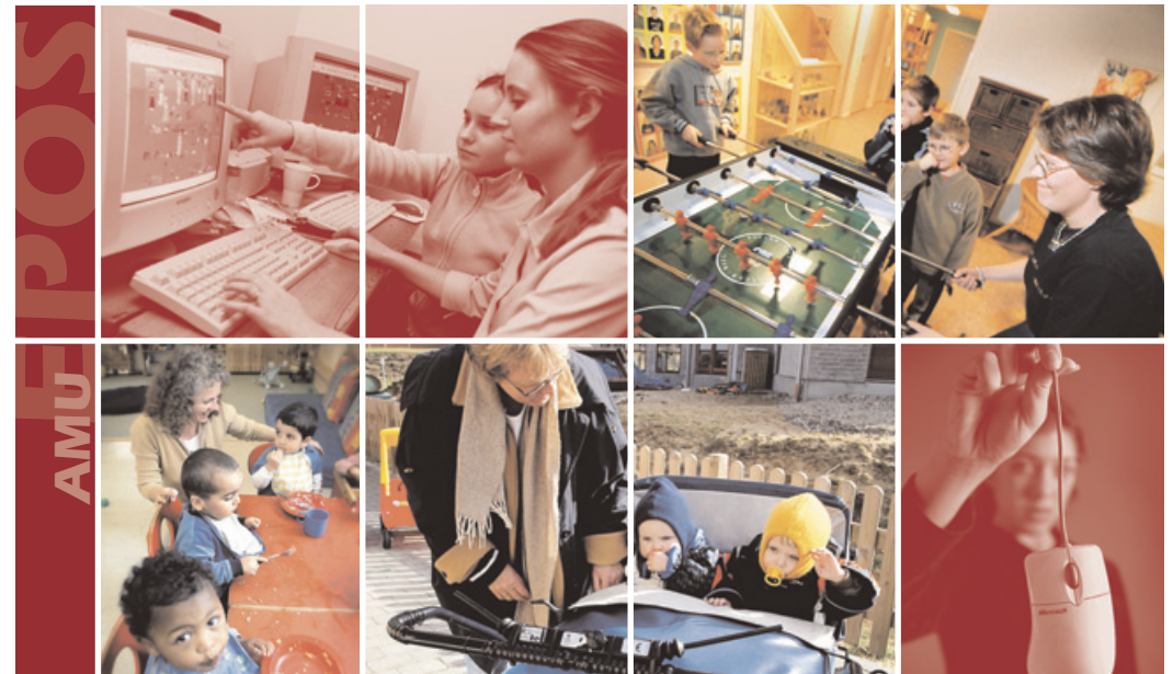
Arbejdsmarkedsuddannelser udviklet af: