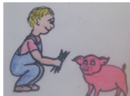
Gav gris mad